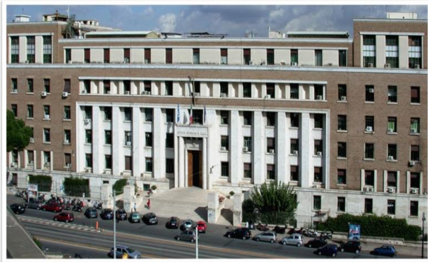
Archivio storico-fotografico dell'Istituto Superiore di Sanità